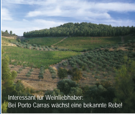
Interessant für Weinliebhaber: Bei Porto Carras wächst eine bekannte Rebe!

Oder erwandern Sie Ihre Urlaubsregion! Besonders im Frühjahr oder im Herbst, eine gute Möglichkeit, Land und Leute näher kennenzulernen. Wandern auf Sithonia ist etwas für Entdecker, die nicht ausgetretenen Pfaden folgen wollen. Zielflughafen für diese Region ist Thessaloniki, die Transferzeit beträgt je nach Ort ca. 1,5 Stunden.